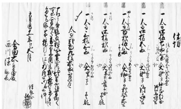
宝暦十一年 紅花仕切