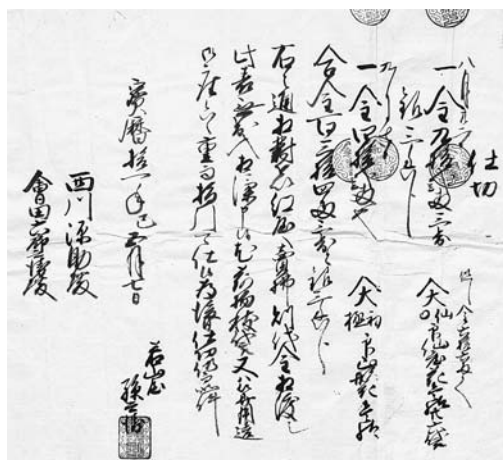
宝暦十一年 紅花仕切