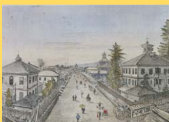
高橋由一《三島県令道路改修記念画帖》 山形大学附属博物館所蔵