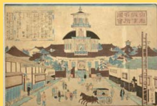
長谷川竹葉《山形県名所図会済生館》 山形大学附属博物館所蔵